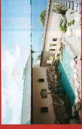
湯あがり処「いっぶく」