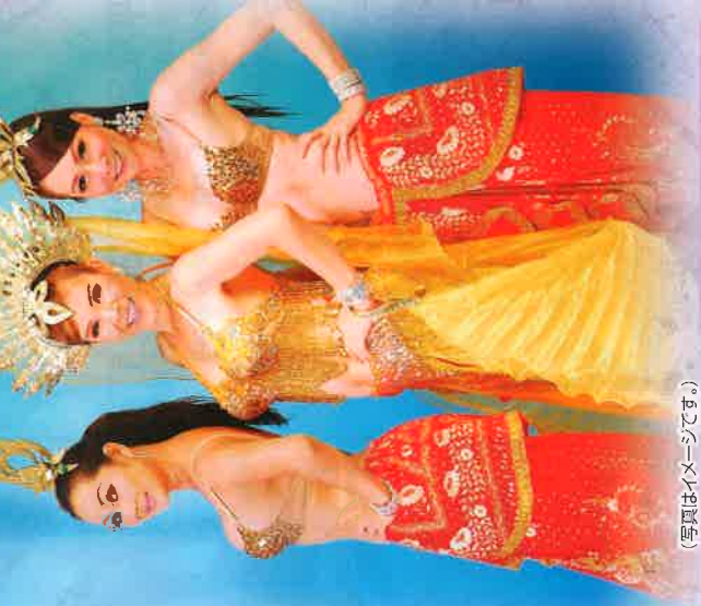
(写真はイメージです。)