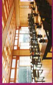
宴会場 (椅子・テーブル)