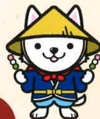
公式キャラクター いせわんこ