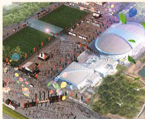
画像はすべてイメージです。