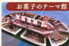
お菓子のテーマ館

歌川広重作浮世絵「伊勢参宮 宮川の渡し」をモチーフに江戸時代のお伊勢参りのにぎわいを巨大工芸菓子で表現。三重県内の和洋菓子職人が匠の技を結集します。