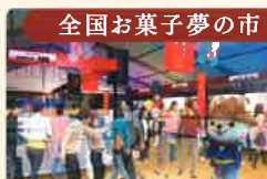
全国お菓子夢の市