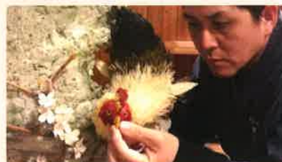
お菓子の匠工芸館 全国の菓匠たちが伝統の技を駆使して作った、美しい工芸菓子を展示します。

「全国菓子大博覧会」はお菓子の歴史と文化を後世に伝えるとともに、菓子業界、関連産業の振興と地域の活性化に役立てるため、ほぼ4年に1度開催されてきました。今回で27回目の開催となり、三重では初めてとなります。1911年(明治44年)に東京で「第1回帝国菓子大品評会」として始まり、東海エリアでは1977年静岡以来の40年ぶりの開催となる「第27回全国菓子大博覧会・三重」にご期待ください。