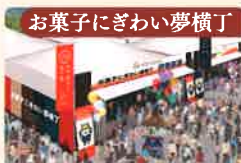
お菓子にぎわい夢横丁

大手お菓子メーカーがお菓子の魅力をPR!いろいろな楽しいイベントで盛り上がりましょう!