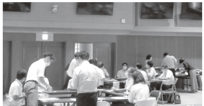
フリートーク風景