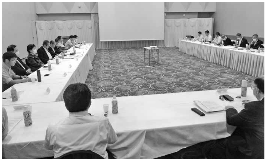
第70回三重労使会議風景