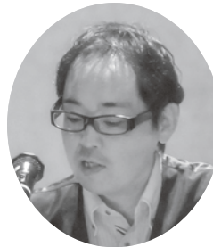
説明をする石川部長