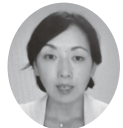
講演する高原講師