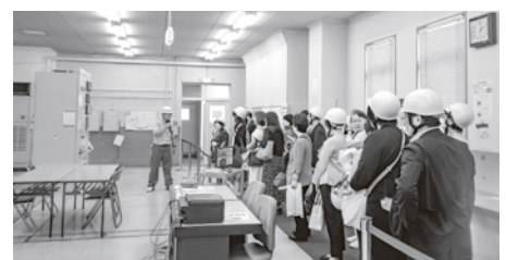
蹴上発電所見学風景