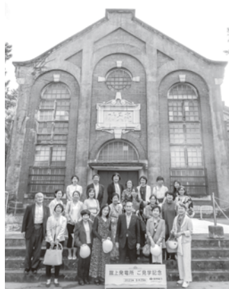
蹴上発電所集合写真