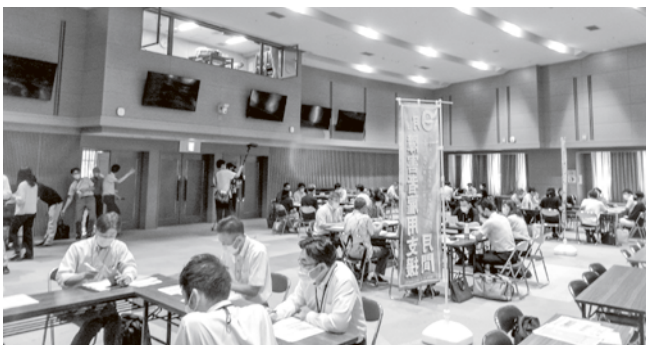
グループディスカッション風景