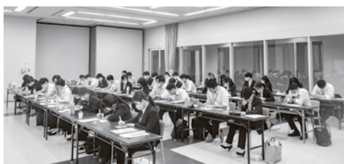
グループ別ミッション風景

また、最後に働く目的を考え、それを踏まえて次回までの行動目標を落とし込みました。